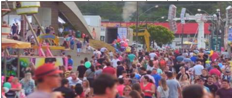
Figura 38 – EXPO CONCÓRDIA - Vista parcial do Parque Municipal de Exposições