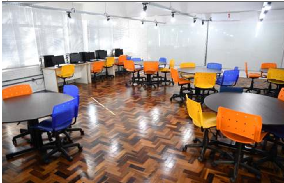
Figura 13 – Sala Business da UnC Concórdia.