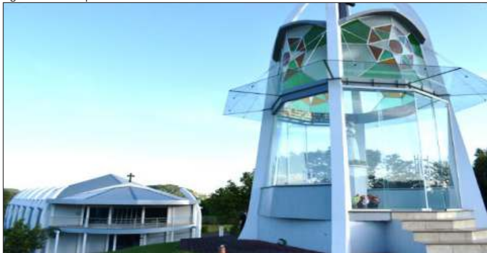
Figura 33 – Vista parcial do Santuário Nossa Senhora da Salete em Concórdia - SC