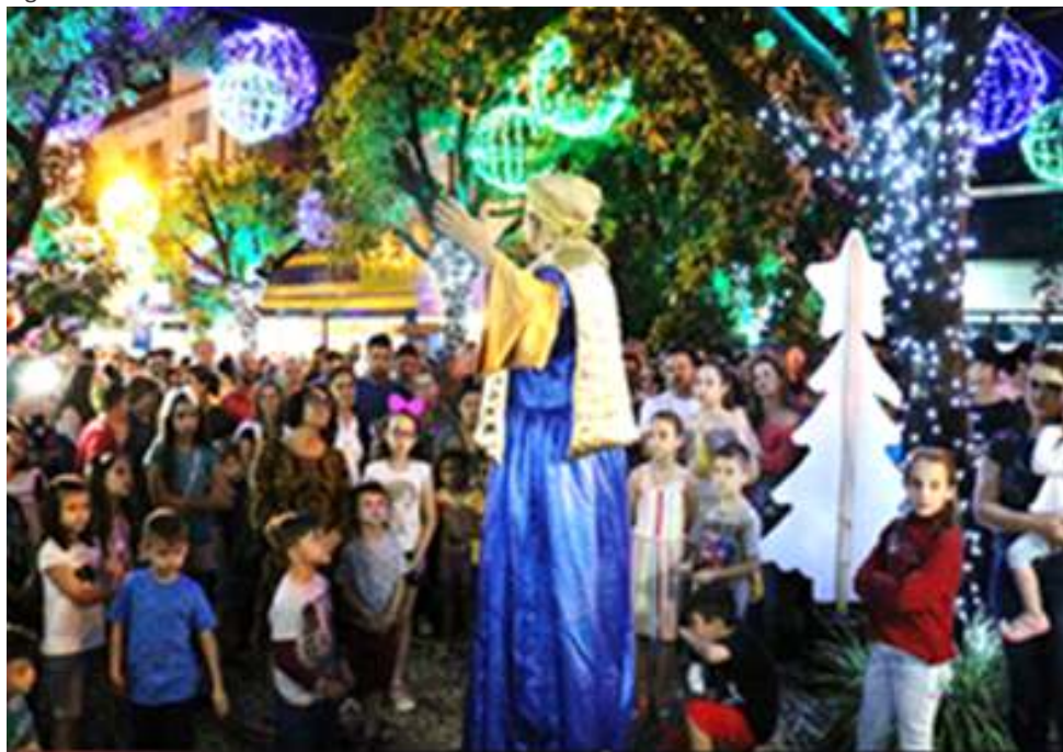
Figura 50 – Caminhos de Natal