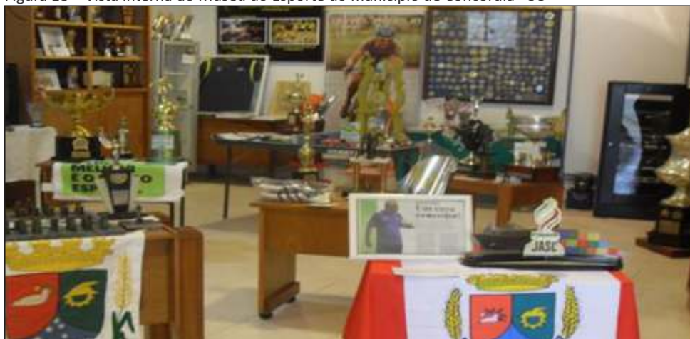
Figura 18 – Vista interna do Museu do Esporte do município de Concórdia - SC