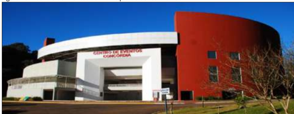
Figura 25 – Centro de Eventos do município de Concórdia - SC