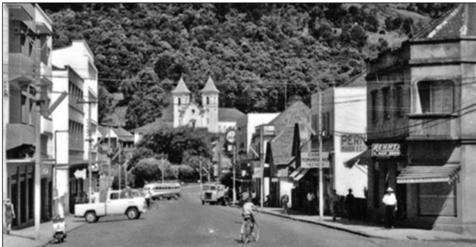
Figura 1 – Concórdia em 1966