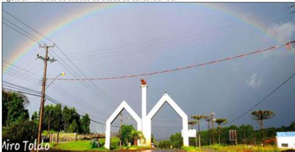
Figura 17 – Pórtico de entrada da cidade de Concórdia - SC.