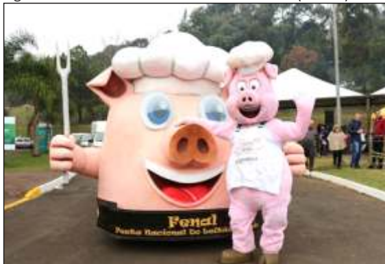
Figura 44 – Festa Nacional do Leitão Assado (FENAL)