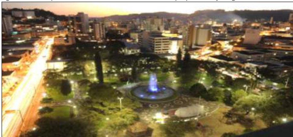
Figura 22 – Vista parcial da cidade de Concórdia com destaque para a Praça Dogello Goss