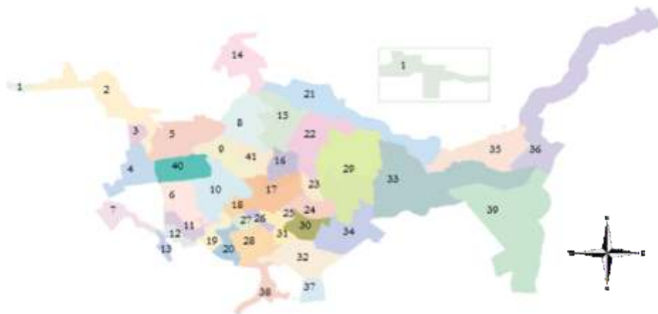
Figura 4 – Bairros que compõem o município de Concórdia-SC

A área urbana do município de Concórdia é constituída por 40 bairros, distribuídos geograficamente conforme demonstrado na figura 04.