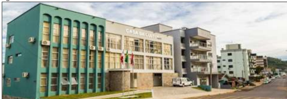
Figura 24 – Casa da Cultura Eliseo João Zanatta