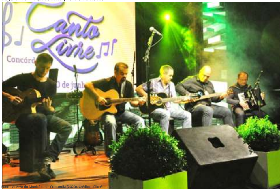
Figura 46 – Apresentação de Artistas