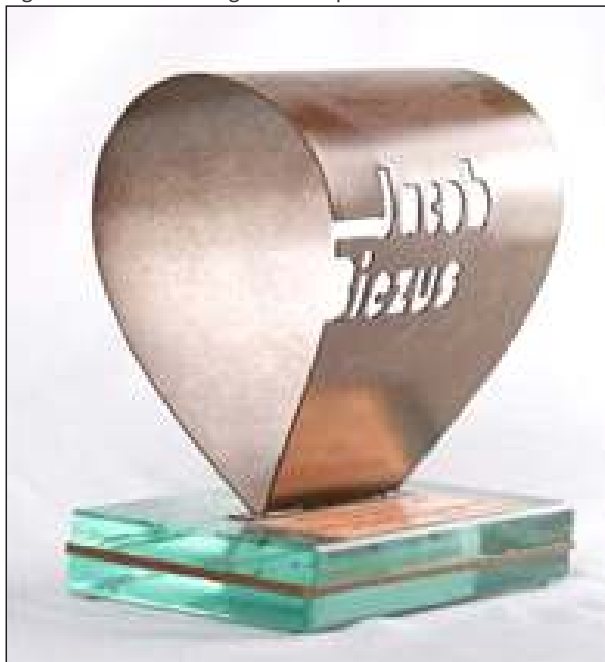
Figura 58 – Troféu entregue aos Empresários do ano