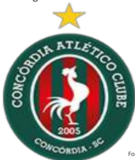
Figura 65 – Logomarca do Concórdia Atlético Clube

Com a aprovação do projeto federal, o CAC está autorizado a captar recursos junto a pessoas físicas e a pessoas jurídicas tributadas pelo lucro real, que se beneficiarão com a dedução do imposto de renda, as pessoas físicas que contribuirão com projetos desportivos ou paradesportivos poderão deduzir até 6% do imposto de renda, enquanto as pessoas jurídicas poderão deduzir até 1% do tributo devido. A seguir podem ser observadas a logomarca do clube, a vista parcial do Estádio Municipal Domingos Machado de Lima e o time e comissão técnica do Galo do Oeste (Figuras 65, 66 e 67).