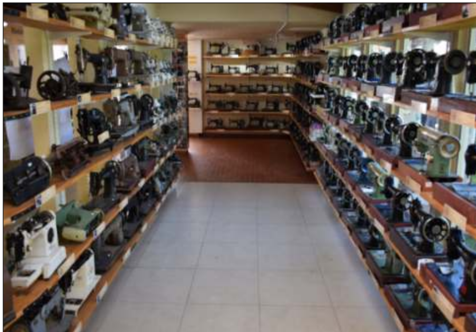
Figura 15 – Museu Ângelo Spricigo