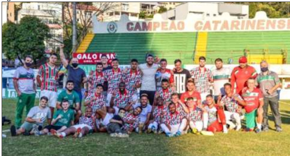
Figura 67 – Time do Galo do Oeste e Comissão Técnica