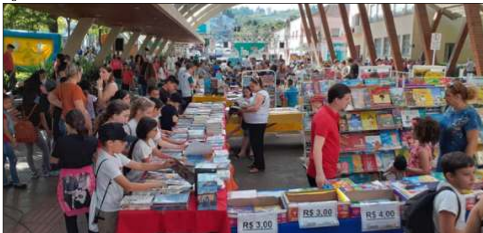
Figura 41 – Feira do Livro realizada na rua coberta