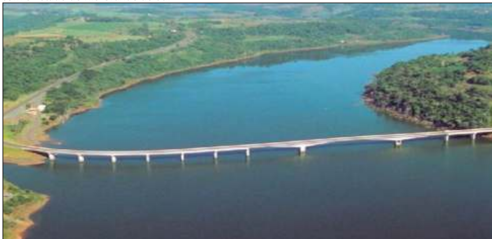
Figura 27 – Vista aérea da Ponte do Rio Uruguai em Concórdia – SC que liga o Estado de Santa Catarina com o Estado do Rio Grande do Sul