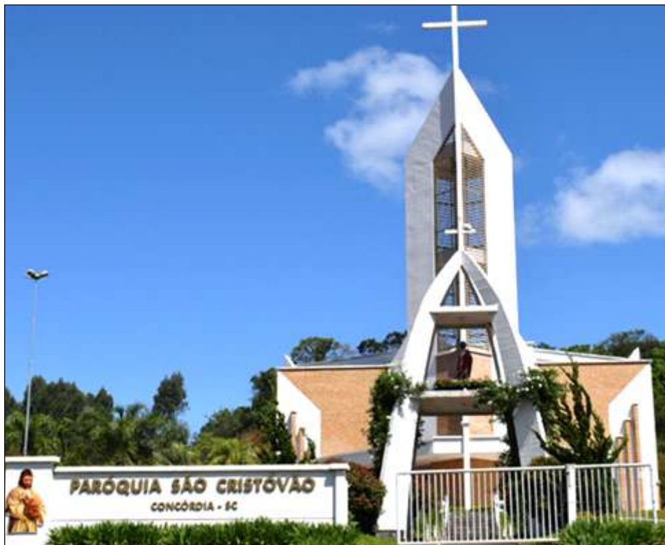
Figura 32 – Fachada da Paróquia São Cristóvão em Concórdia - SC