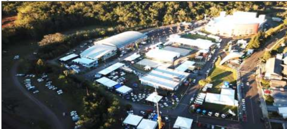
Figura 43 – Vista do Parque de Exposições durante a FEMIX