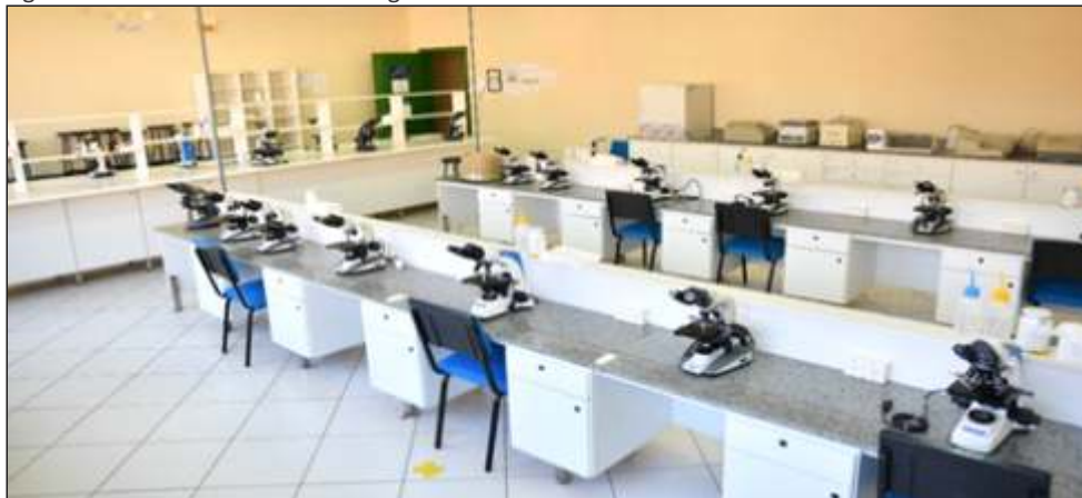
Figura 8 – Laboratório de Hematologia da UnC Concórdia

O campus Concórdia dispõe de uma consolidada infraestrutura laboratorial adequada às atividades de ensino e pesquisa desenvolvidas nos cursos de graduação e pós-graduação lato e stricto sensu . O campus conta com um complexo de laboratórios de Ciência e Tecnologia (CLCT) destinado às áreas da Saúde, Biológicas e Engenharias, conforme apresentado nas figuras 08 e 09.