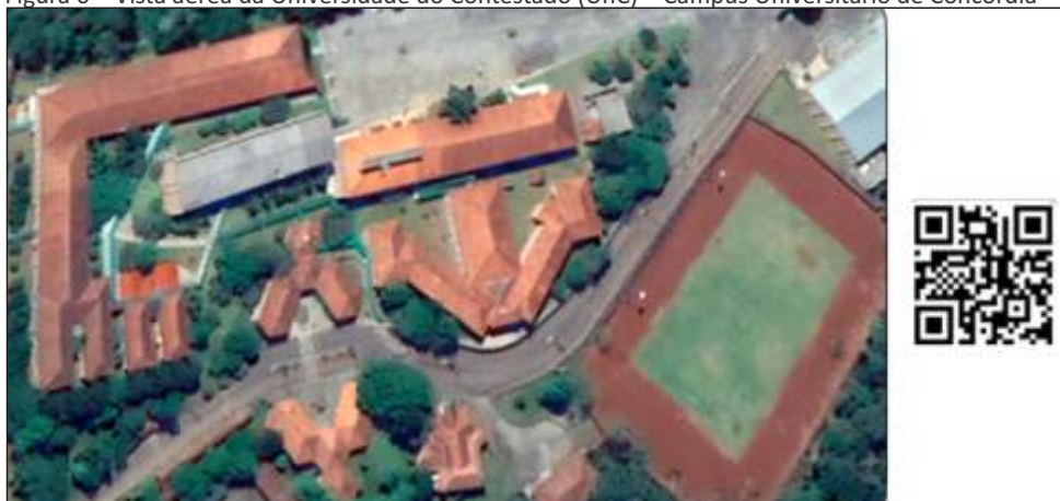
Figura 6 – Vista aérea da Universidade do Contestado (UnC) – Campus Universitário de Concórdia

O campus da Universidade do Contestado em Concórdia está localizado a 3km do centro da cidade, possui uma arquitetura moderna, estrutura física ampla e constantemente adequada às demandas de sua comunidade acadêmica. O campus Concórdia da UnC está situado em meio a áreas de matas secundárias, compondo uma bela paisagem (Figura 06).