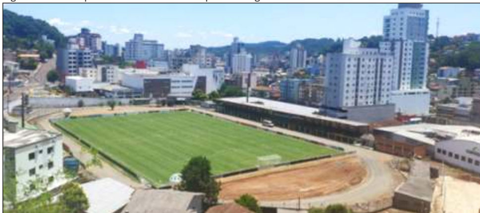
Figura 66 – Vista parcial do Estádio Municipal Domingos Machado de Lima