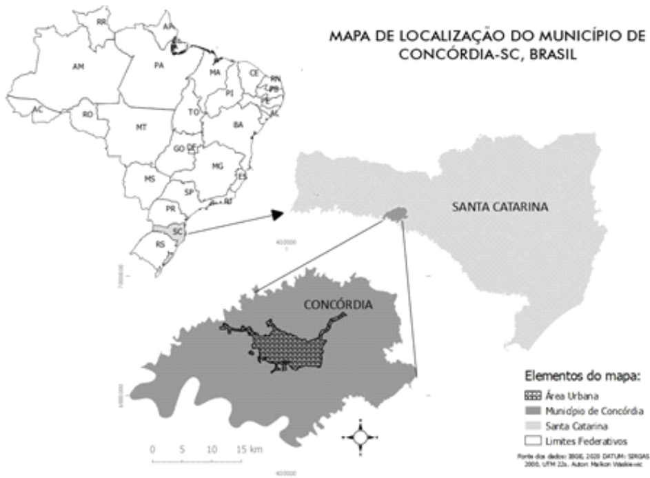
Figura 2 – Localização geográfica do município de Concórdia – SC