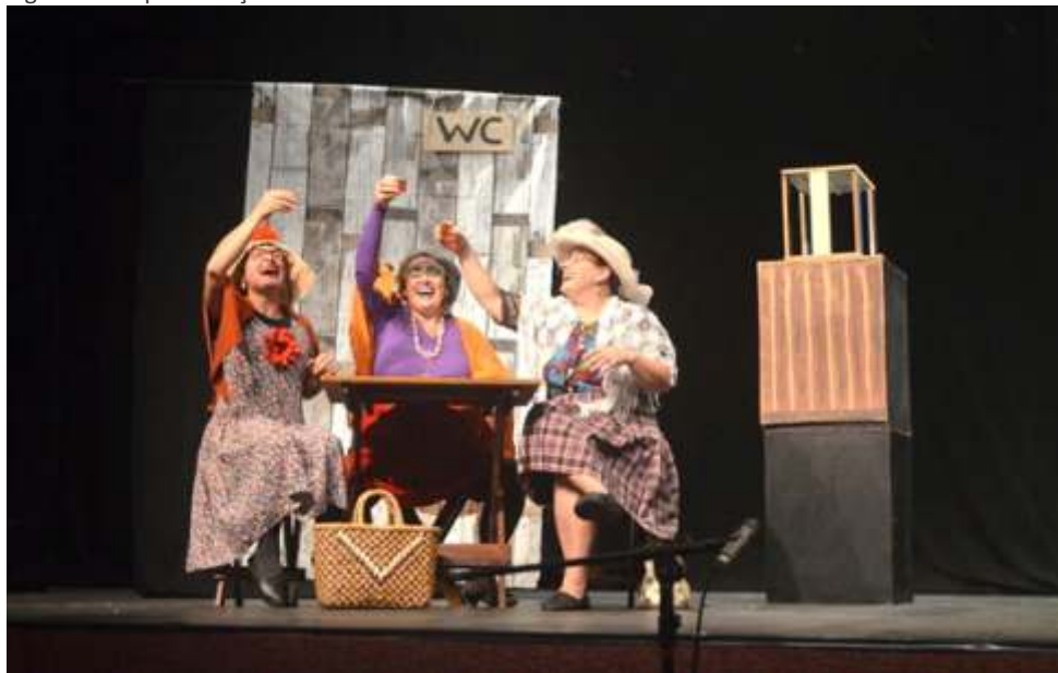
Figura 48 – Apresentação de Teatros