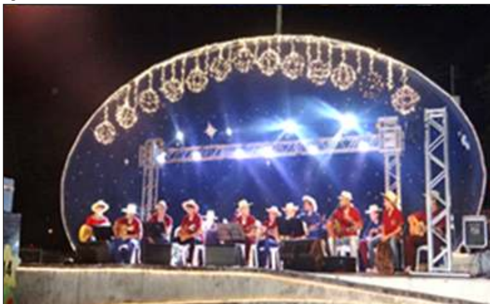
Figura 52 – Caminhos de Natal