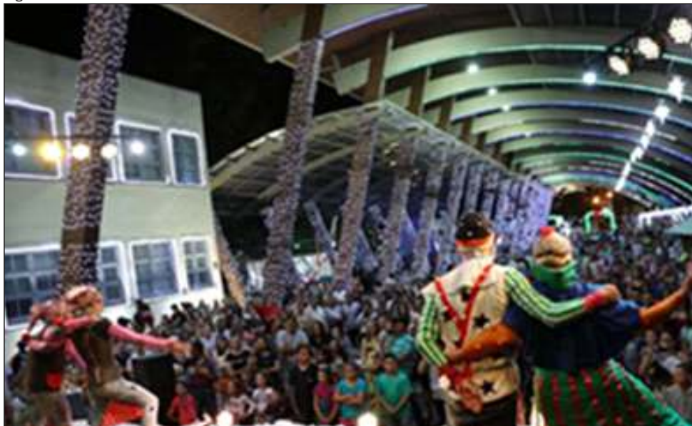
Figura 53 – Caminhos de Natal