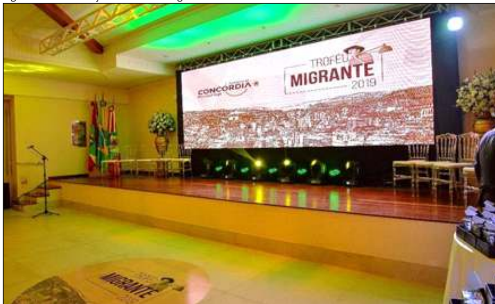
Figura 57 – Premiação do troféu Migrante 2019