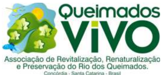
Figura 64 – Logotipo Queimados Vivo