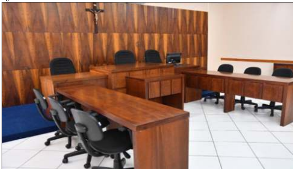
Figura 11 – Núcleo de Práticas Jurídicas da UnC Concórdia

Dentre a ampla e qualificada estrutura que a UnC disponibiliza à comunidade concordiense, cabe destacar o Núcleo de Práticas Jurídicas - NPJ. O principal objetivo do NPJ é possibilitar aos acadêmicos do curso de Direito o exercício teórico/prático de processos jurídicos à pessoa física, através de atenção sociojurídica à população carente. Portanto, além de contribuir para uma formação de excelência dos futuros bacharéis em Direito, o Núcleo presta importante serviço ao município e região (Figura 11).