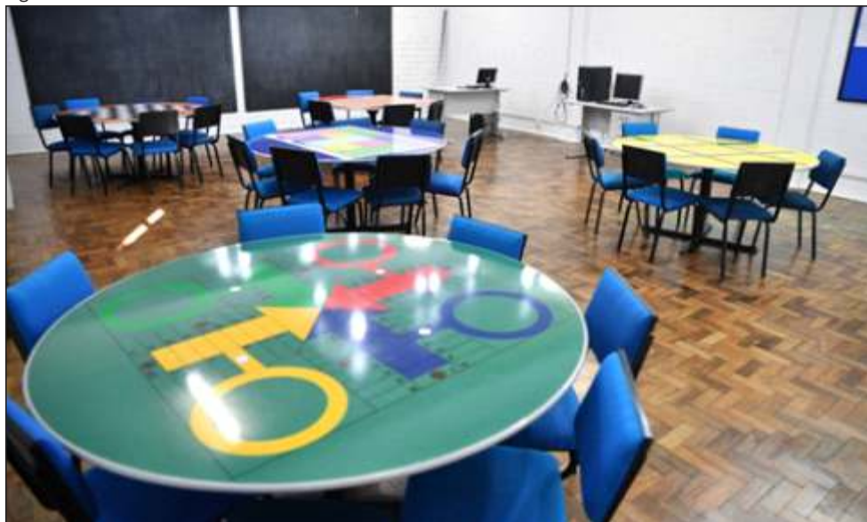
Figura 14 – Sala Maker da UnC Concórdia.