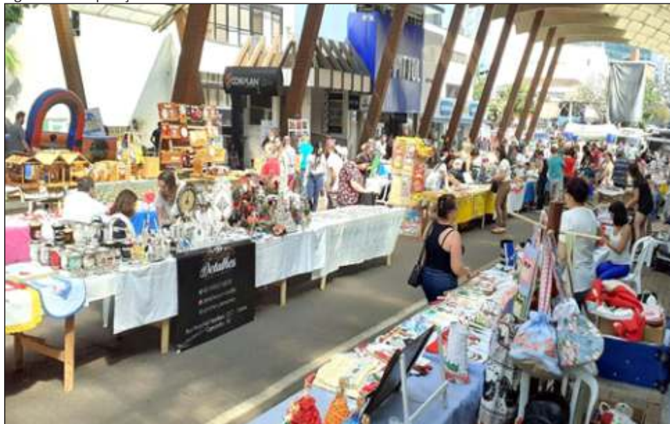
Figura 42 – Exposição de trabalhos durante as feiras