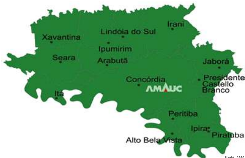
Figura 3 – Localização geográfica dos municípios do Alto Uruguai Catarinense que compõem a Associação dos Municípios do Alto Uruguai Catarinense – AMAUC