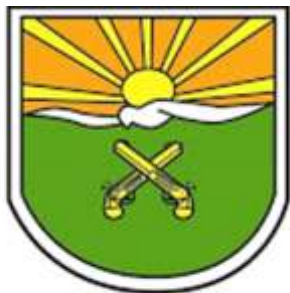
Figura 63 – Logotipo Polícia Militar Ambiental de Santa Catarina.