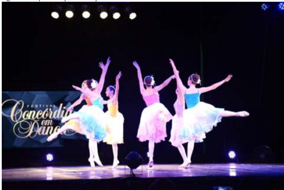
Figura 47 – Apresentação de danças

Fonte: Acervo do Município de Concórdia (2020). Crédito: Júlio Gomes