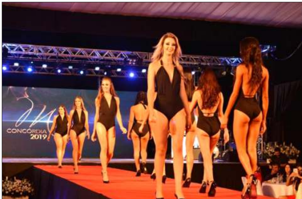
Figura 49 – Desfile das candidatas a Miss Concórdia