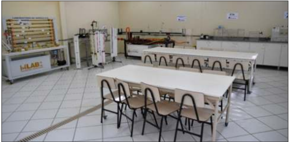
Figura 9 – Laboratório de hidráulica da UnC Concórdia