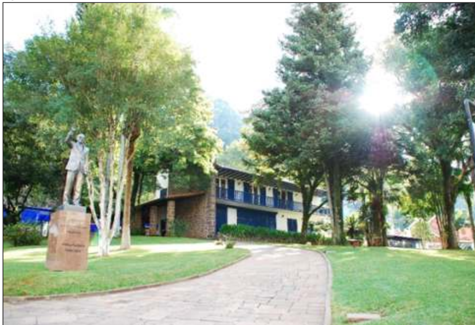
Figura 54 – Entrada Memorial Attilio Fontana