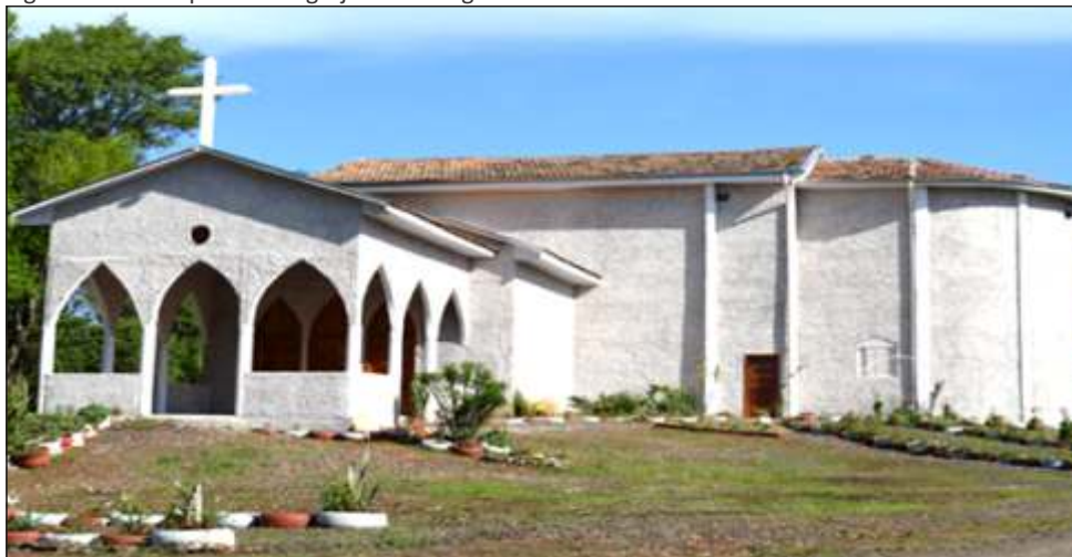
Figura 34 – Vista parcial da Igreja Santa Augusta em Concórdia - SC