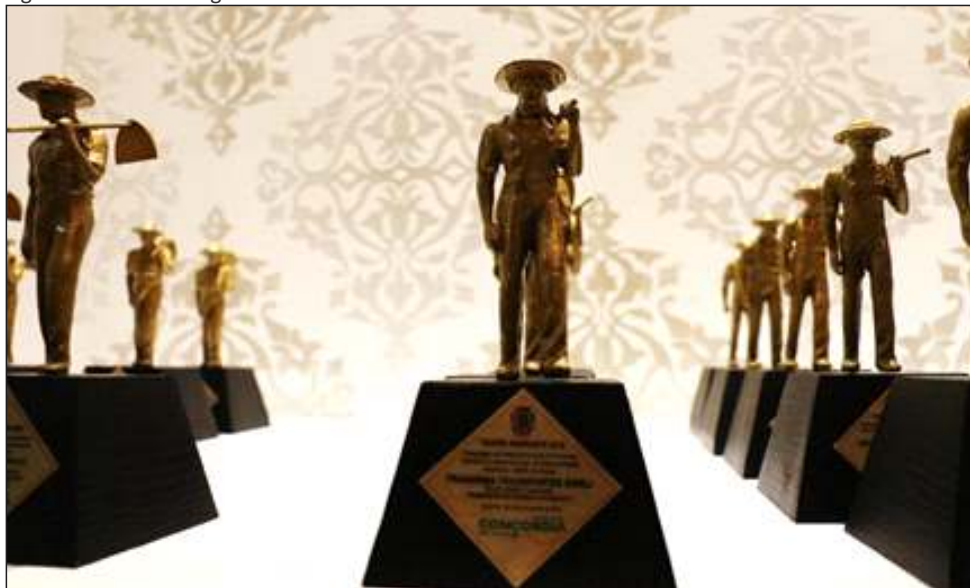
Figura 56 – Troféu Migrante