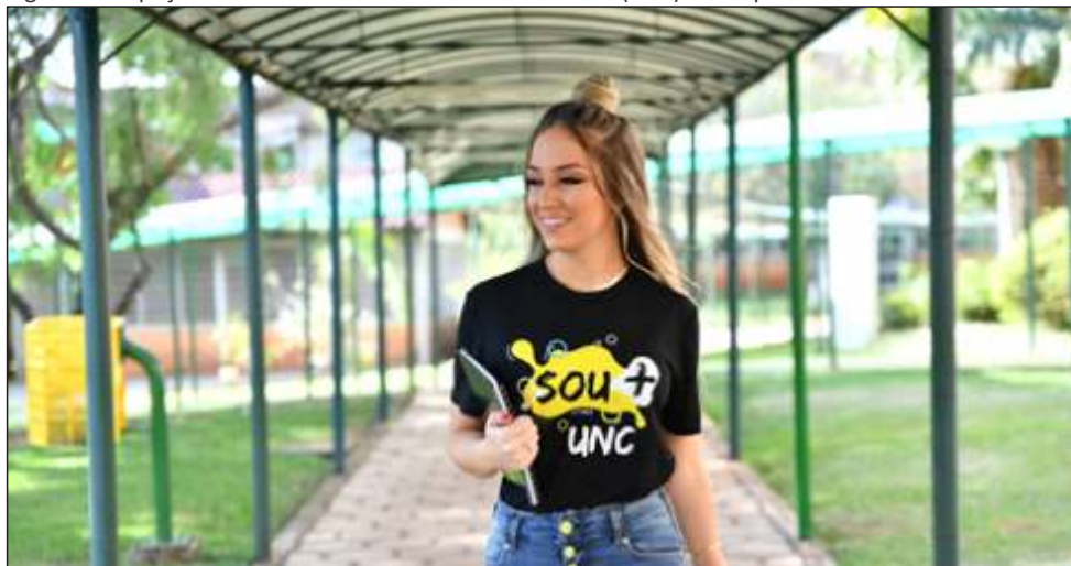
Figura 7 – Espaço externo da Universidade do Contestado (UnC) – Campus Universitário de Concórdia