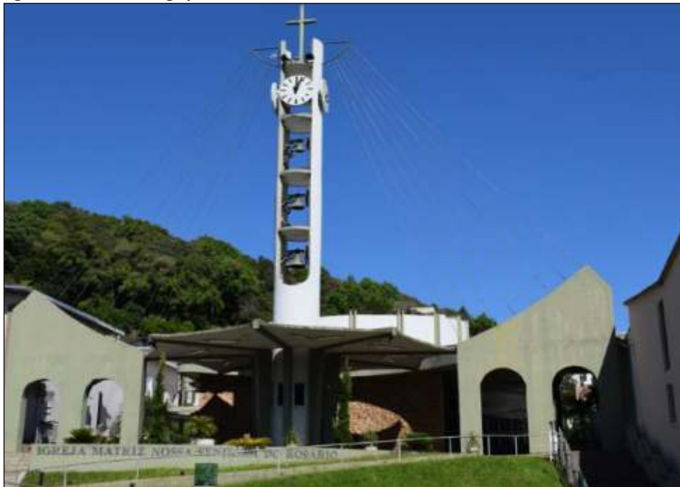
Figura 31 – Fachada da Igreja Matriz Nossa Senhora do Rosário em Concórdia - SC