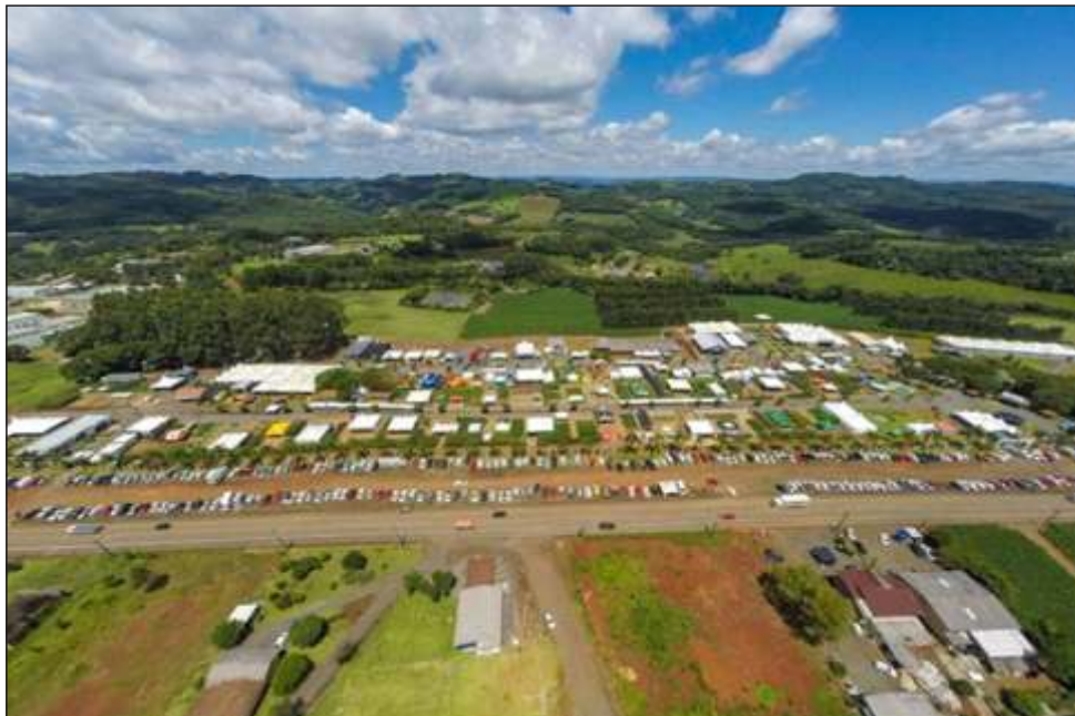
Figura 55 – Vista área da Tecnoeste