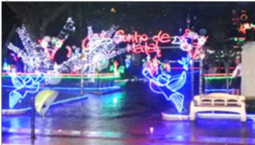
Figura 51 – Caminhos de Natal