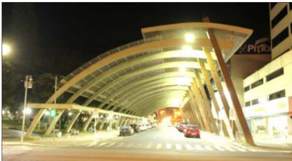
Figura 21 – Vista parcial da Rua Coberta na cidade de Concórdia - SC