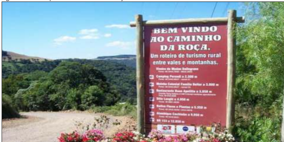
Figura 28 – Vista parcial do Caminho da roça em Concórdia - SC