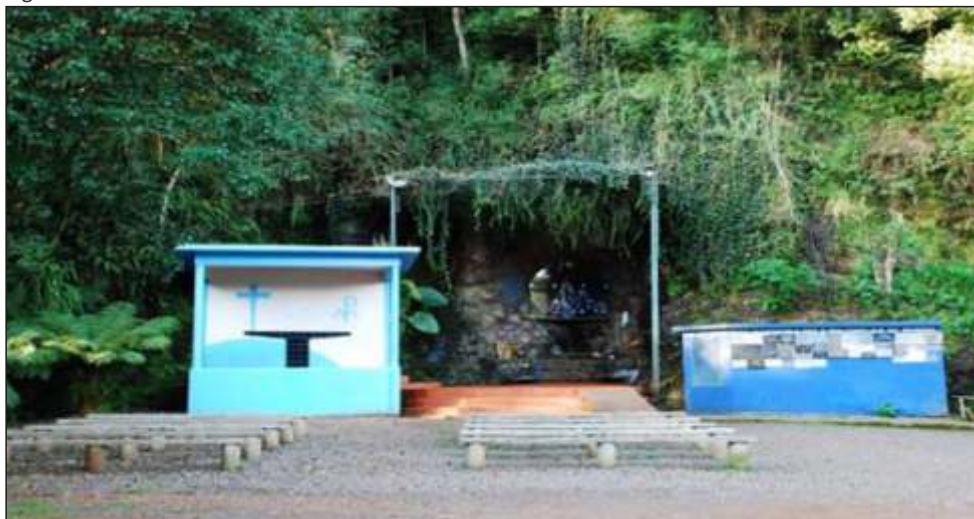
Figura 30 – Vista da Gruta Nossa Senhora de Lourdes em Concórdia - SC