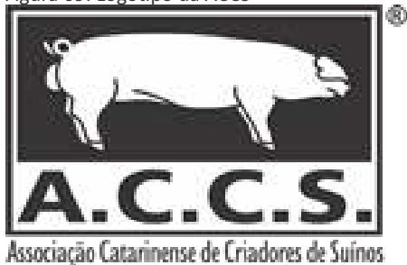
Figura 69: Logotipo da ACCS