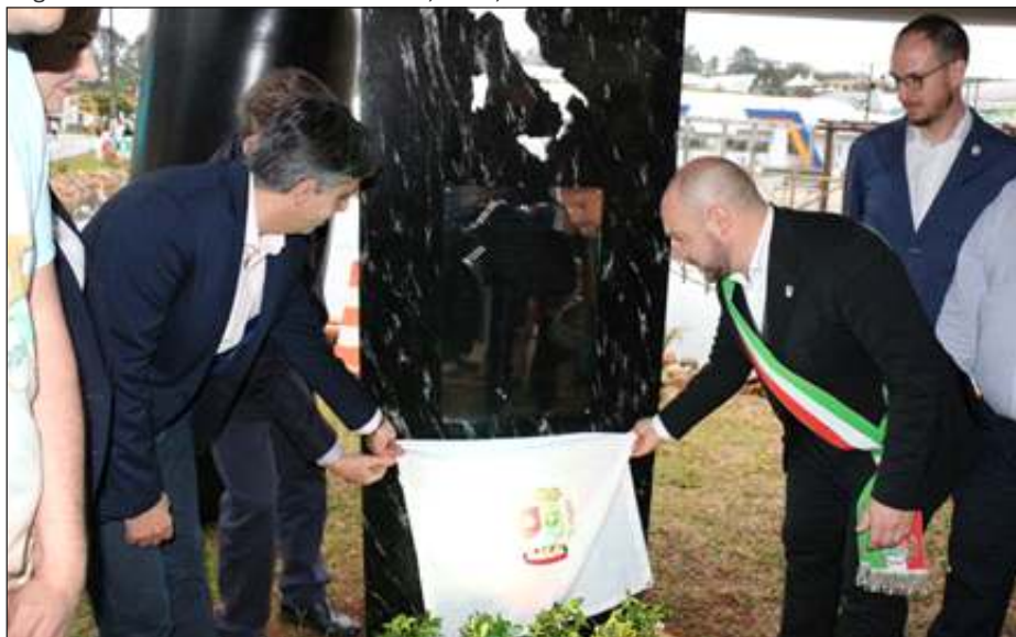
Figura 23 - Descerramento da placa de inauguração da Praça Sarcedo, pelo Prefeito de Concórdia, Rogério Pacheco e Prefeito de Sarcedo, Itália, Luca Cortese.