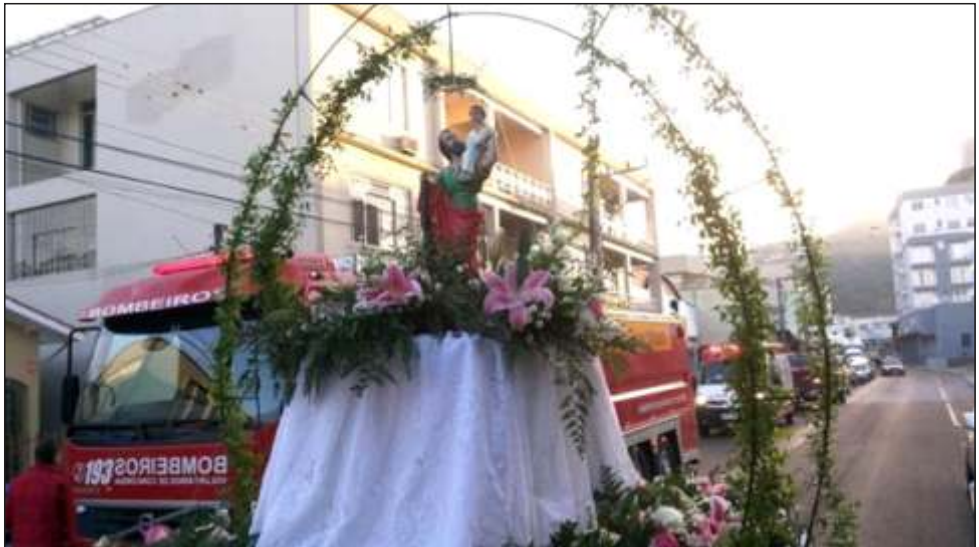
Figura 45 – Imagem do Padroeiro durante a procissão