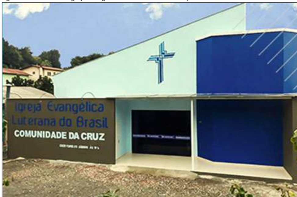
Figura 35 - Fachada da Igreja Evangélica Luterana de Concórdia/SC

A Igreja Evangélica de Confissão Luterana no Brasil também está presente na Paróquia de Concórdia, vinculada ao Sínodo Uruguai, com a denominação Comunidade Luterana da Cruz - Concórdia/SC – Igreja Evangélica Luterana do Brasil (Figura 35).