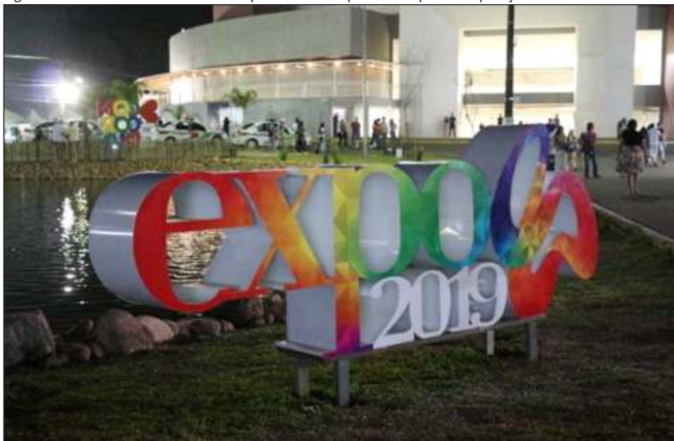
Figura 39– EXPO CONCÓRDIA - Vista parcial do Parque Municipal de Exposições