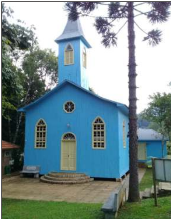
Figura 29 – Fachada da Igreja Pinheiro Preto em Concórdia - SC