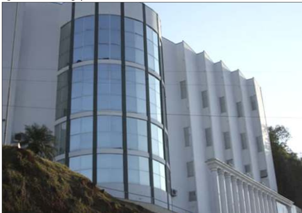
Figura 36 – Fachada da Igreja Eira Church