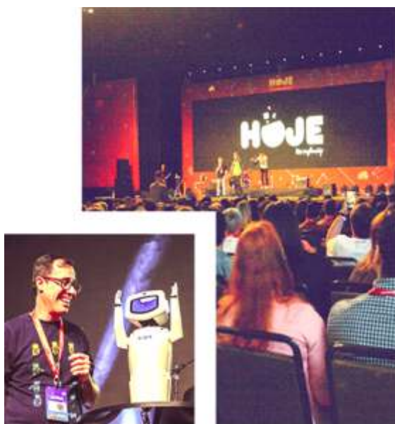
Figura 40 – Evento Hoje

O evento “HOJE”, realizado pela A9 Performance e ACIC, em parceria com a UnC, inova a cada ano com novos conceitos de empreendedorismo, impulsionando e modernizando a cultura tecnológica, pela criatividade e organização de todos os setores da sociedade. Acontece no Centro de Eventos localizado no Parque de Exposições e atrai um grande público, sendo o maior do Oeste e o segundo maior evento do ramo no Estado (Figura 40).