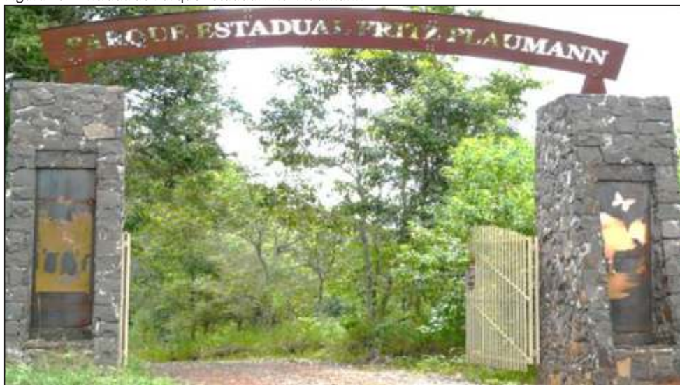
Figura 26 – Entrada do Parque Estadual Fritz Plaumann

Fonte: Acervo do Munic pio de Conc rdia (2020).