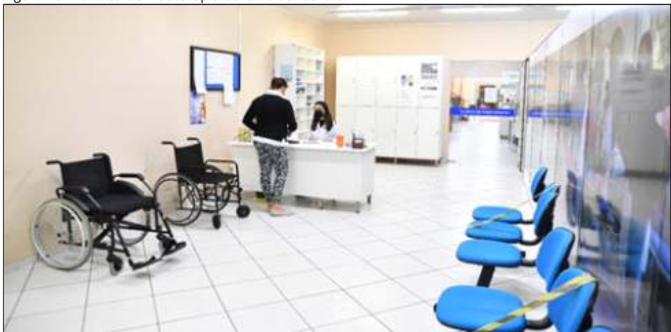
Figura 10 – Clínica de Fisioterapia da UnC Concórdia.

A UnC Concórdia conta ainda com a Clínica de Fisioterapia, cujo objetivo precípua consiste em proporcionar aos acadêmicos do curso a vivência prática fisioterápica, por meio da realização de atendimento aos pacientes, nas áreas de Clínica Escola e Comunitária (Figura 10).