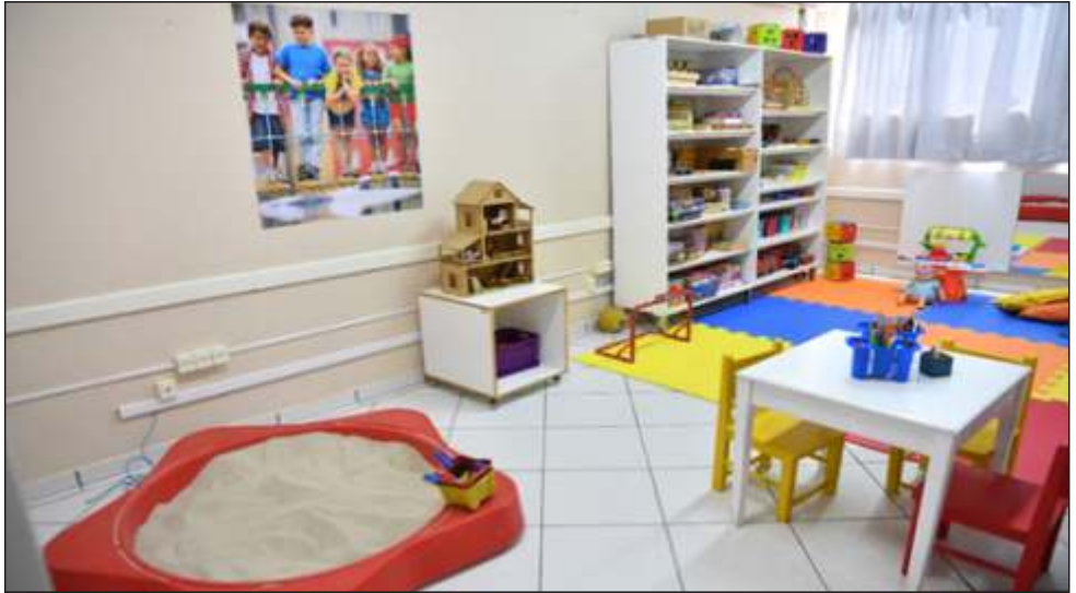
Figura 12 – Núcleo de Serviços em Psicologia da UnC Concórdia