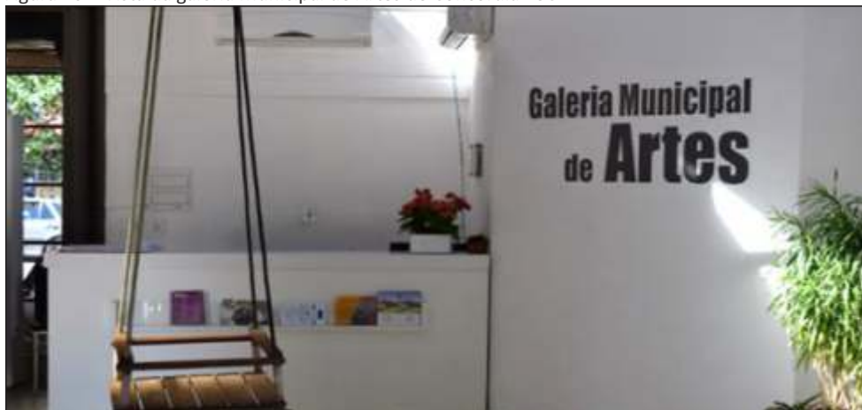
Figura 16 – Vista da galeria Municipal de Artes de Concórdia - SC