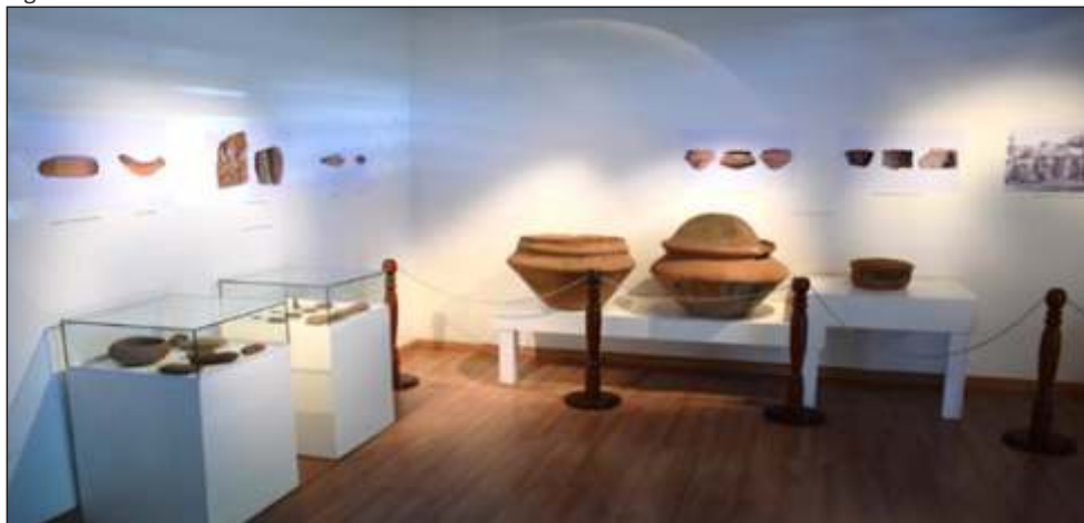
Figura 19 – Vista interna do Museu Histórico Hermmano Zanoni