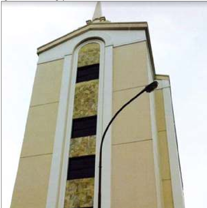
Figura 37 – Fachada da Igreja Jesus Cristo dos Santos dos Últimos Dias