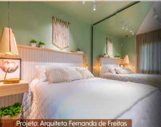
Projeto: Arquiteta Fernanda de Freitas