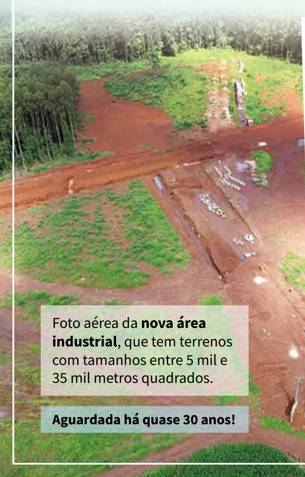
Foto aérea da nova área industrial , que tem terrenos com tamanhos entre 5 mil e 35 mil metros quadrados.