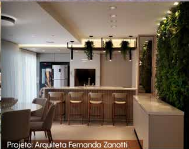
Projeto: Arquiteta Fernanda Zanotti