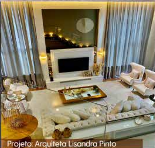
Projeto: Arquiteta Lisandra Pinto