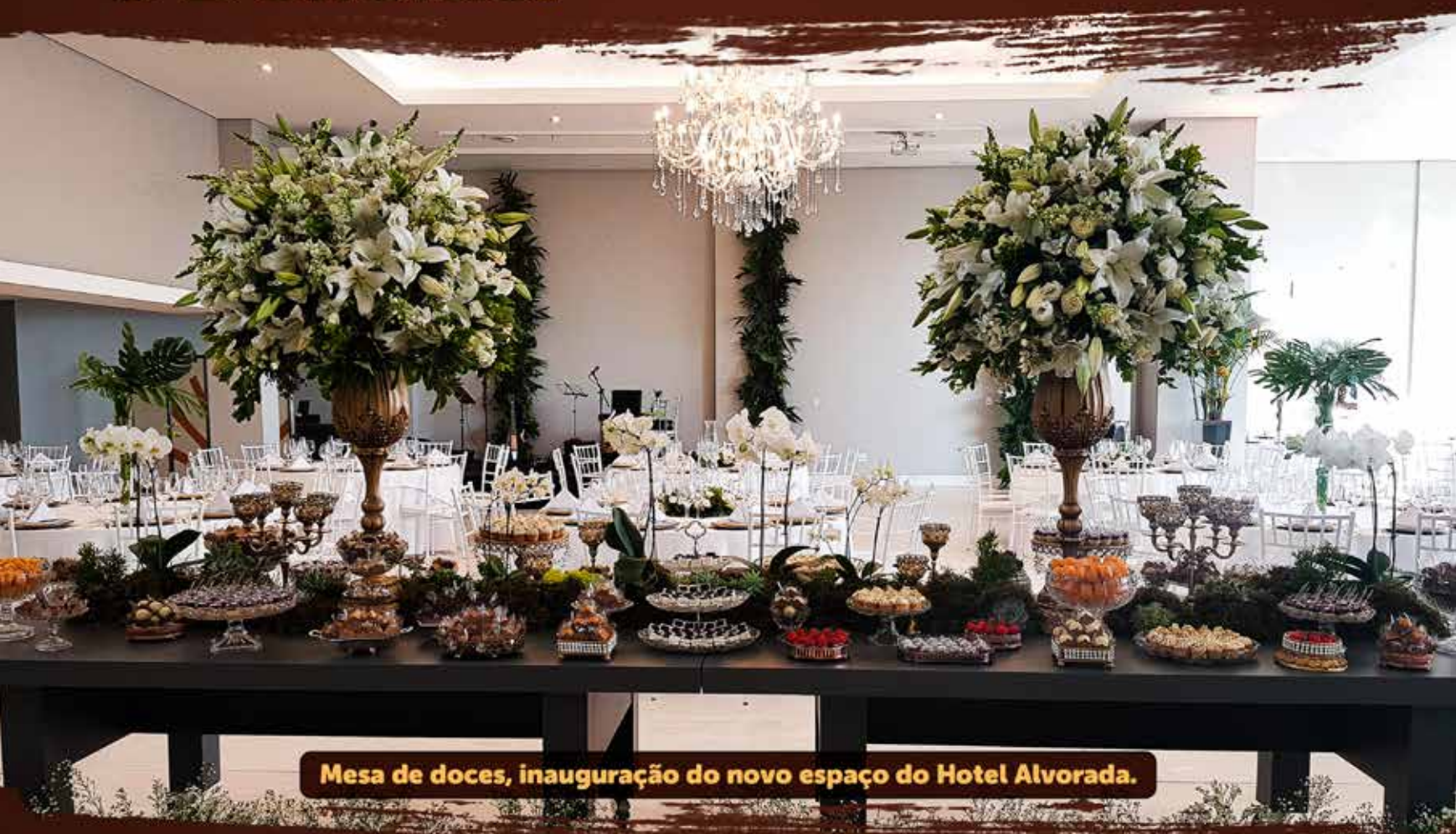
Mesa de doces, inauguração do novo espaço do Hotel Alvorada.